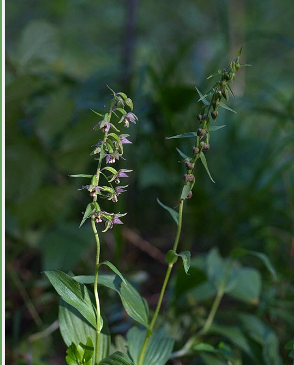
Lehtoneidonvaippa, Paraisten nimikkokasvi