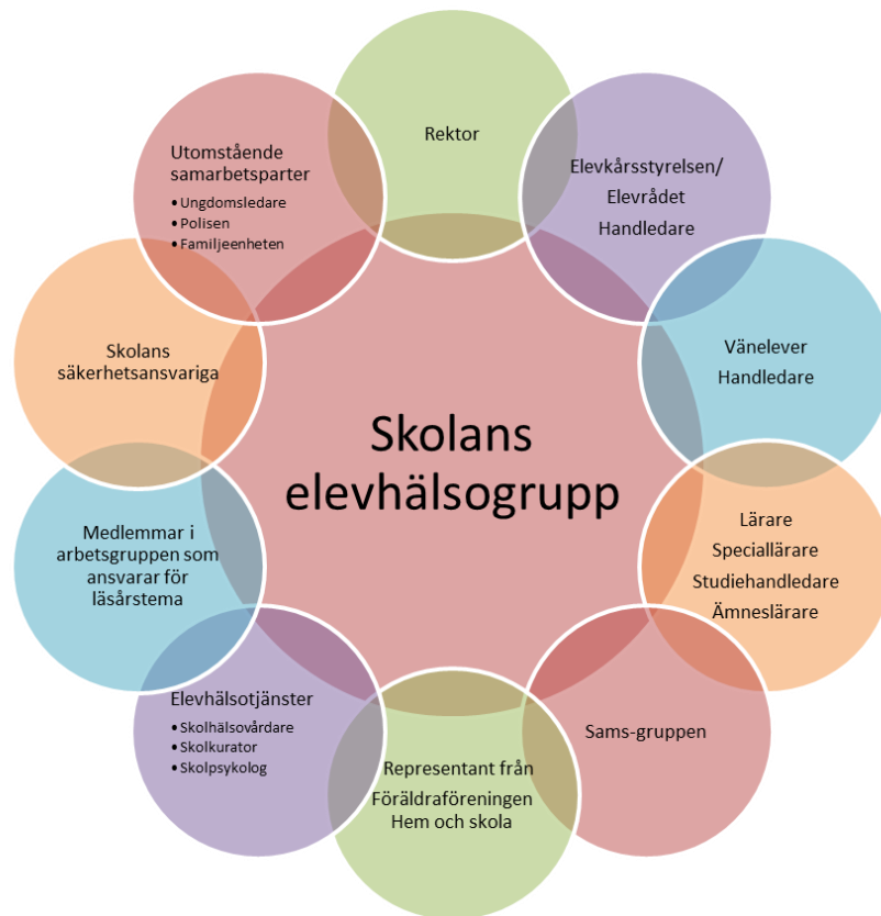
Bild 2. Skolans elevhälsogrupp är mångprofessionell och sammanbinder skolans verksamheter på en bred front. Elever och vårdnadshavare är en viktig del av skolans elevhälsoarbete.

Rektor fungerar som ordförande för elevhälsogruppen och gruppen består förslagsvis av: