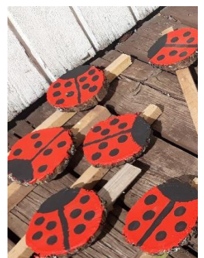
Leppäkerttuja. Kuva: Ankkuripuisto

https://www.facebook.com/Familjehuset-Ankaret-Perhetalo-Ankkuri-149878565681878/