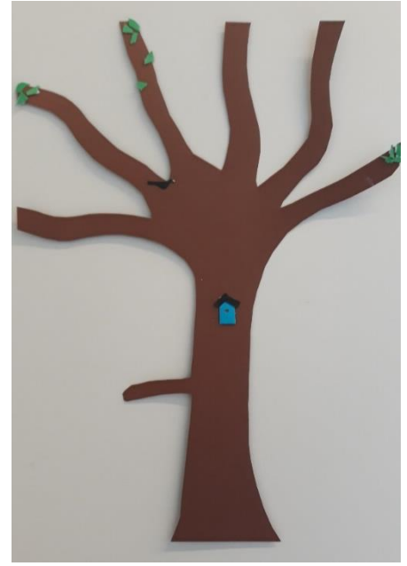
Askartele puu.