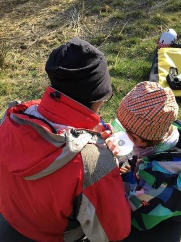
"Nauhoita" luontoääniä.