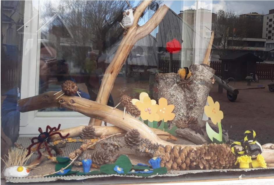
Askartele maisema.