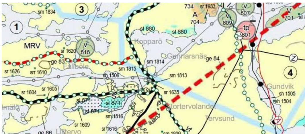
Kuva 3: Ote Varsinais-Suomen maakuntakaavasta.

Sattmarkin tilan ohi kulkeva maantie 180 on osoitettu maakuntakaavassa seututienä ja ohjeellisena ulkoilureittinä.