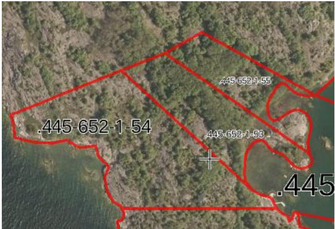
Flygbild av Alskär.