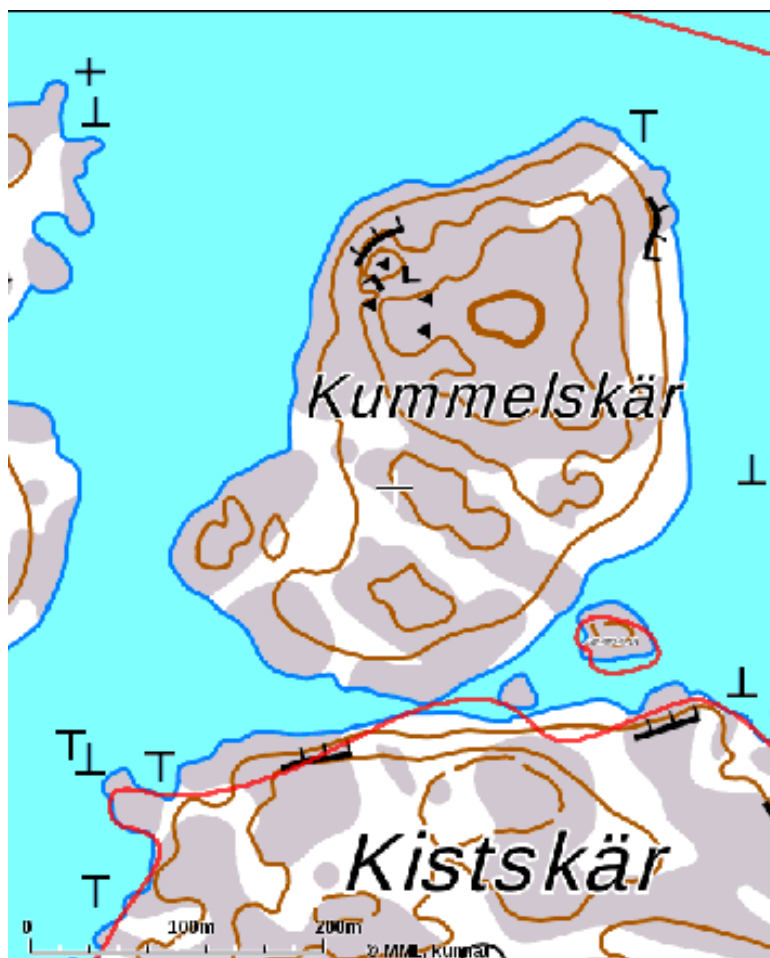
Hela Kummelskär hör till Södergrannas 1:55 och planområdet.