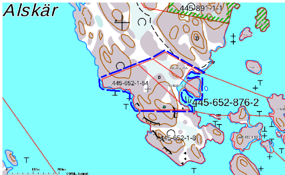
Fastighetsindelningen på Alskär. Planområdet i blå avgränsning.