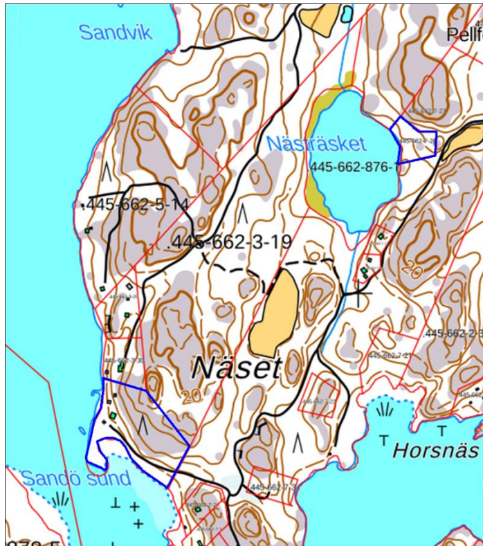
Kaava-alue on rajattu sinisellä viivalla. Kiinteistö Träskas sijoittuu Nästräsketin rannassa.