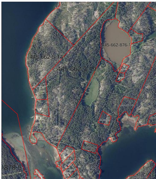
Maanmittauslaitoksen ilmakuva kaava-alueesta.