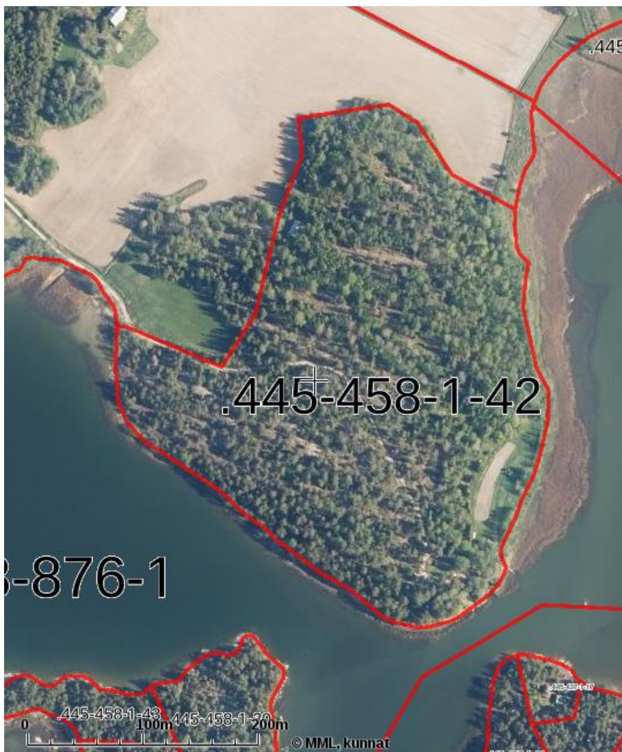
Byängensuddensin Maanmittauslaitoksen ilmakekuva.