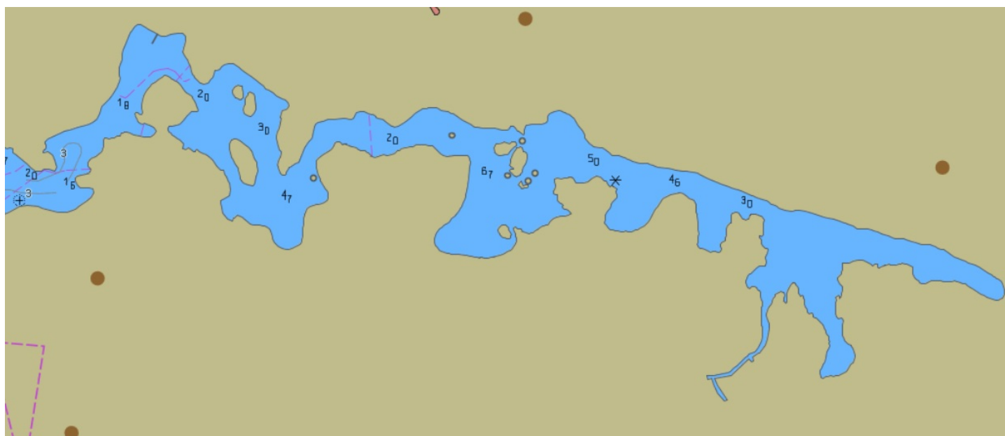
Bild 2. Ett uttag ur ett sjökort (Trafikledsverket 2019) visar punktvis några djup i viken.

Långvikens vattendjup varierar från sundens 2-3 meter till de bredare vattenområdenas bottensänkor, där vattendjupet är 4-7 meter (bild 2). Variationen i vattendjupet inverkar bl.a. på vattenutbytet och på vikens strömmar.