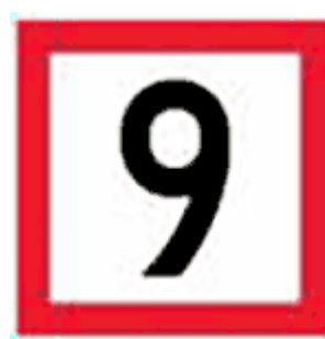
Bilderna 11 ja 12. Svallförbuds- och hastighetsbegränsningsskylt.