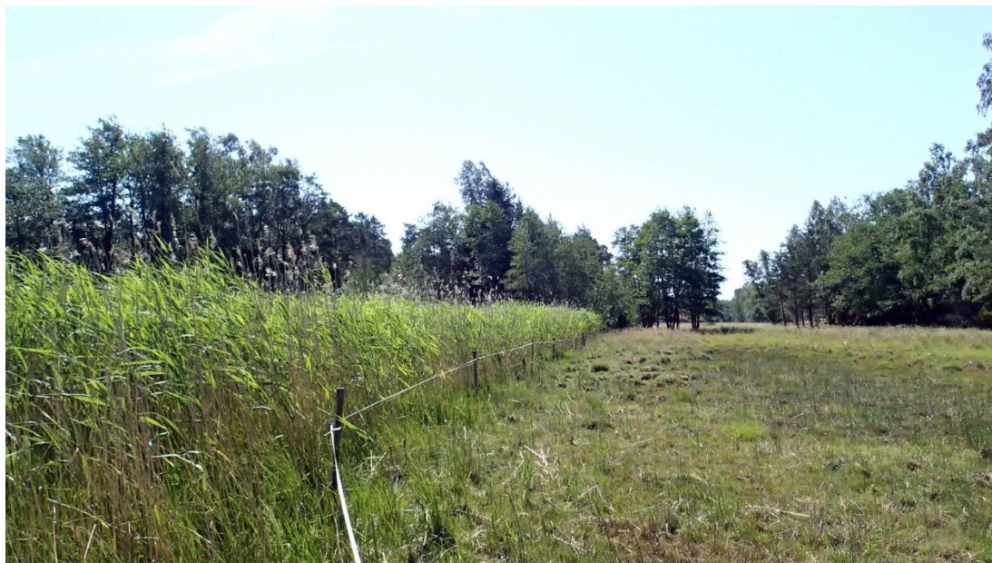
Bild 13. Traditionellt bete inverkar på landvassen, Markomby viken (EH)

https://www.ymparisto.fi/fi-FI/VELHO/Ruovikoiden_hyotykaytto