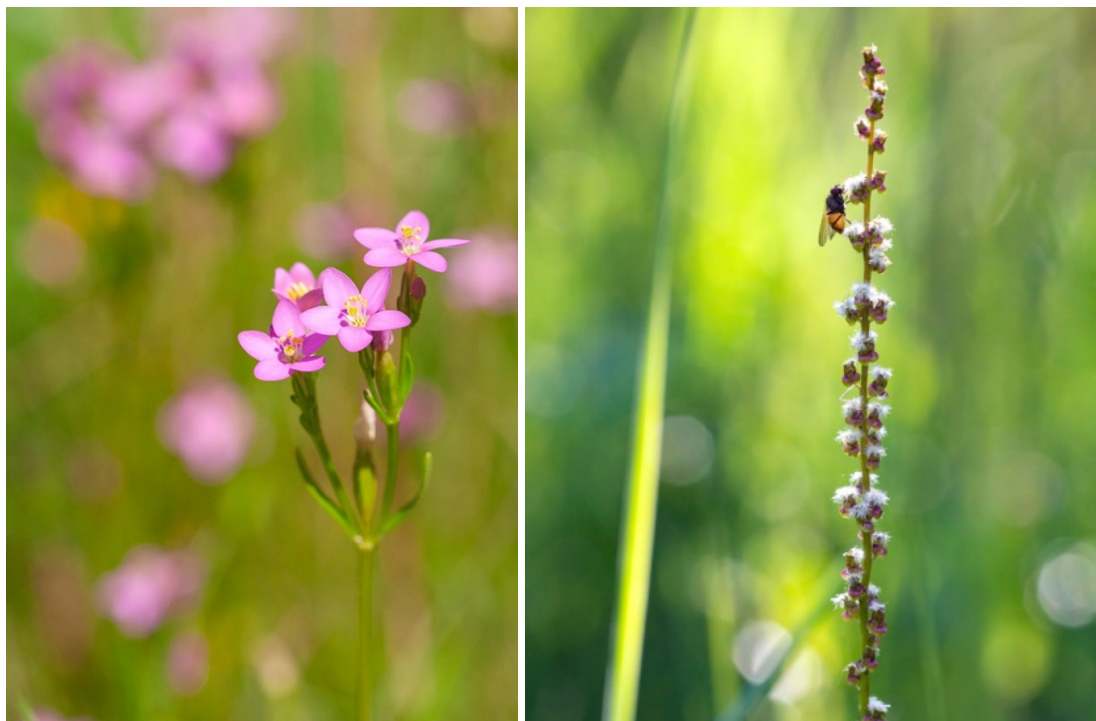
Bilderna 6 och 7: Smalarun (vänster) och kärrsälting (höger) förekommer ännu på Långvikens strandängar, fastän även de har blivit ovanligare då betet har minskat. (EE)

Lundarna är till sin artsammansättning de mest värdefulla biotoper som finns runt viken. Hasselbuskarna vanliga i lundarna. Andra betydande arter är bl.a. värärt, bergmynta, grönvit nattviol och gullviva. Största delen av lundarna är gamla hagar och i en del fann man mer krävande arter ss luktsmåborre, småborre, gulmåra, jungfrulin och brudbröd, som är kvarlevor från de tider skogarna var naturbeten. Av dessa är gulmåra och jungfrulin utrotningshotade och sårbara arter. Förutom de redan ovan nämnda arterna, förekommer det på torrängarna i byarna mer krävande, sydvästliga ängsarter, som bl.a. darrgräs, backlök, piggstarr och backnejlika.