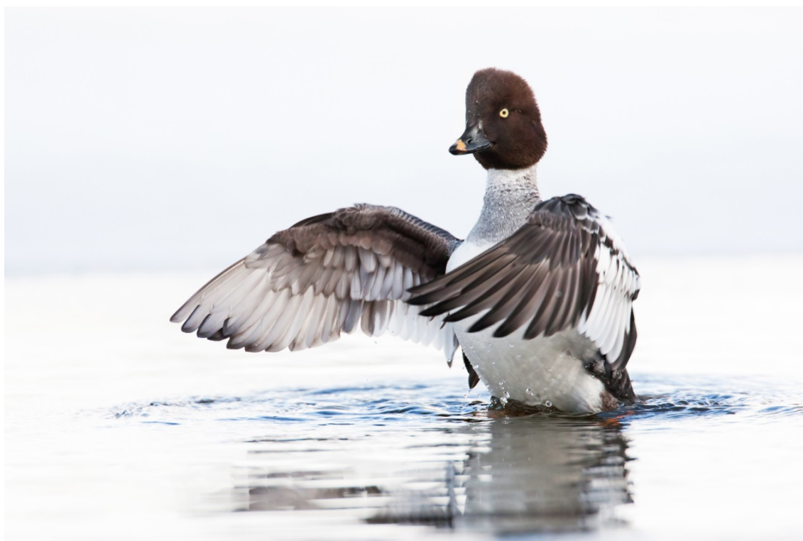
Bild 8. Knippan trivs enbart i sådana vatten, som har levande botten. Som näring använder knippan bottendjur dvs. insekter, kräftdjur och musslor. (EE)

De allt ovanligare sävsparvarna och rosenfinkarna häckar i vikens strandvätmarker. Även tranorna brukar häcka i Långvikens vida vassruggar. Bland annat svarthättan hör till de arter som häckar i strandskogarna.