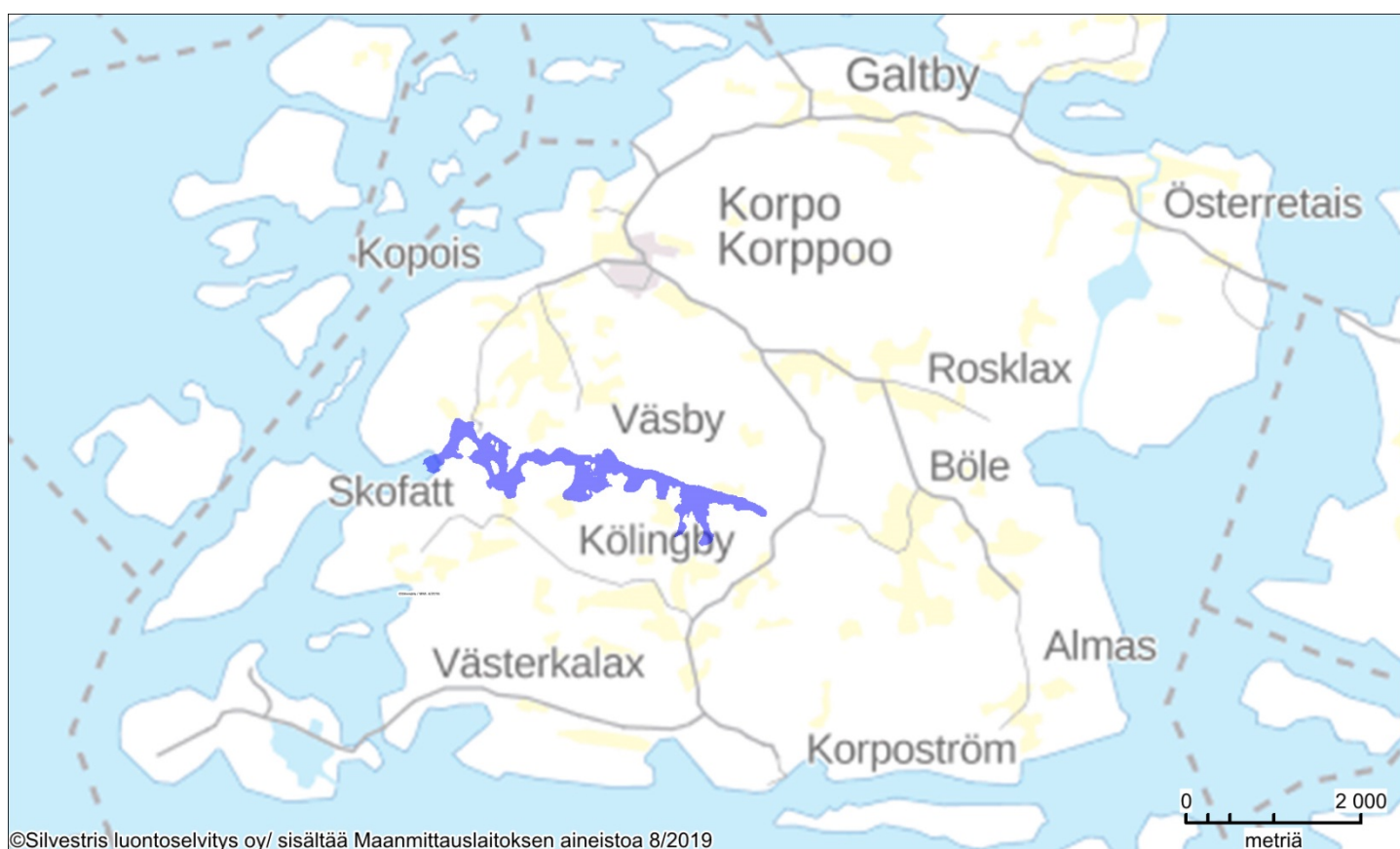
Bild 1. Långviken ligger mitt Korpo. Vikens yta är ca 100 hektar, varav största delen hör till Natura 2000-området.